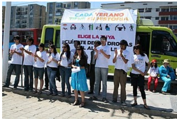
Campaña antidroga CONACE-INJUV