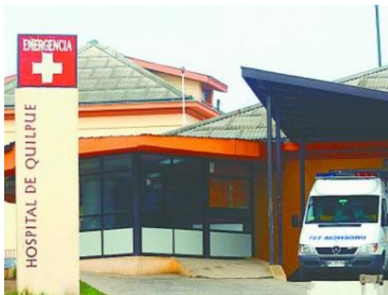
Hospital de Quilpué