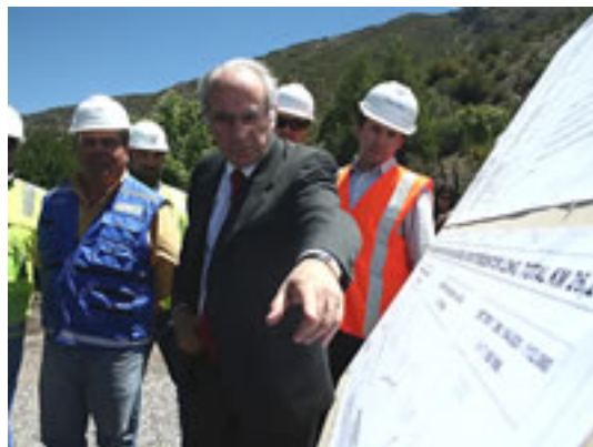
Visita ruta 60-CH

La Ruta 60 CH es el principal eje terrestre de integración bioceánica y de conexión internacional del país con el resto del mundo, asociado al Paso Los Libertadores y a los principales puertos del país, como Valparaíso y San Antonio. El Objetivo de estas obras es recuperar el nivel de servicio de esa Ruta Internacional, en cuanto al deterioro que presenta la carpeta de rodadura, mejorar el drenaje y saneamiento de la plataforma, de igual manera realizar una serie de obras de conservación y estabilización de taludes y control de caída de rocas. El objetivo es evitar cortes en la ruta, ya sean en período invernal o estival. Producto de lo anterior, será mejorada la seguridad vial de la ruta, mediante una completa señalización, incorporando obras de seguridad y protección para dotar de una mayor seguridad al usuario. En este mismo concepto, se deberá mejorar algunas estructuras existentes en la ruta (varios puentes, pasarelas, pasos superiores, obras de contención, etc.). Cabe señalar que el mejoramiento sustancial de la Ruta 60 CH, también constituye uno de los compromisos de la Presidenta de la República. El monto de la obra asciende el 2010 a M$10.760.000. y se espera beneficiar cerca de 5000 habitantes.