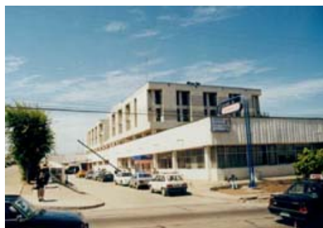
Hospital Claudio Vicuña

FONASA transfiere un alto monto a cada uno de los servicios de salud regionales, para financiar prestaciones de salud AUGE, inversión que solo al SSVSA asciende a la suma de M$ 8.637.576. Por otro lado la inversión en infraestructura no es menor, acá se destaca los proyectos del subtítulo 31 como Normalización Hospital Claudio Vicuña que se enmarca en el área de mejoramiento de la red de infraestructura y servicios. El sistema de salud debe estar permanentemente dotado de equipos modernos y de tecnología en todos los servicios con la finalidad de ser eficiente, mejoramiento de la gestión de la red asistencial de salud mediante el desarrollo de un modelo de atención intrahospitalario eficiente y el equipamiento moderno. El solicitado año es de M$122.213